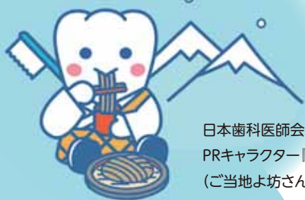
日本歯科医師会 PRキャラクター「よ坊さん」 (ご当地よ坊さん長野県)

飯田下伊那歯科医師会では住民の皆様の生涯にわたる歯とお口の健康づくりを支援し、健康寿命の延伸のために貢献したいと日々研鑽をしています。お口に関わることでお悩みがありましたら、ご遠慮なくご相談ください。